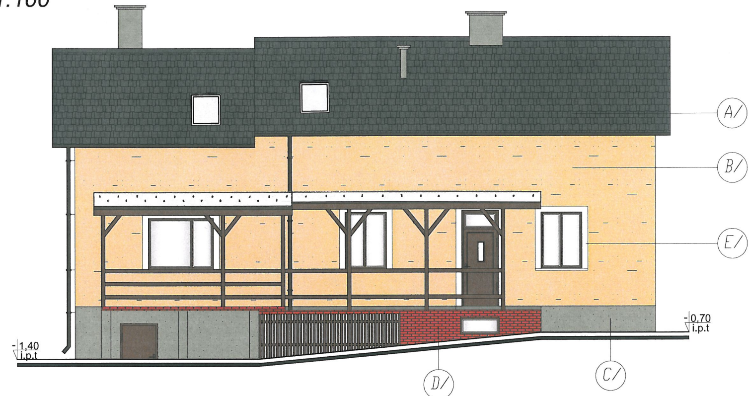
Elewacja północna skala: 1:100